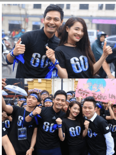
Đồng Phục Sự Kiện