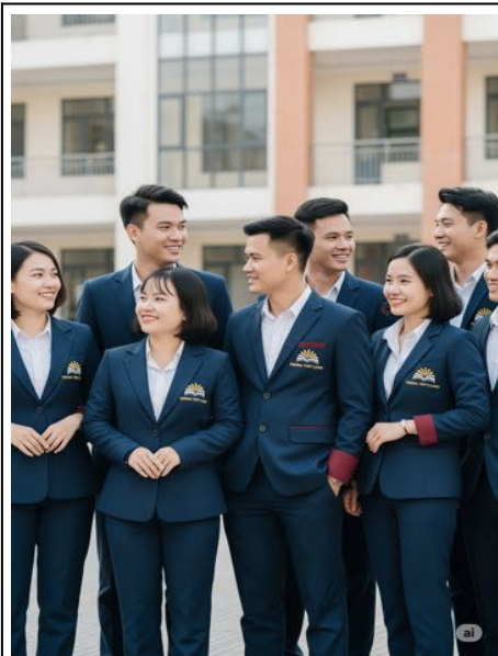
Đồng Phục Văn Phòng

Đồng phục trong doanh nghiệp là biểu tượng của gắn kết, kỷ luật và niềm tự hào tập thể. Từ đồng phục văn phòng đến đồng phục sự kiện, mỗi thiết kế đều mang tính chuyên nghiệp và nhất quán trong nhận diện. Một hệ thống đồng phục bài bản chính là bước khởi đầu cho môi trường doanh nghiệp hiện đại và có chiều sâu văn hoá.