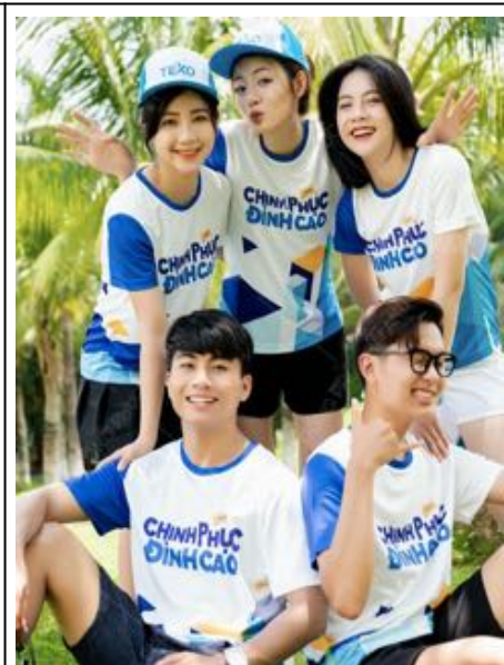
Đồng Phục Du Lịch