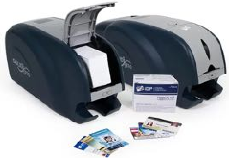
Máy In Thẻ Để Bàn Giúp Chủ Động In Ấn