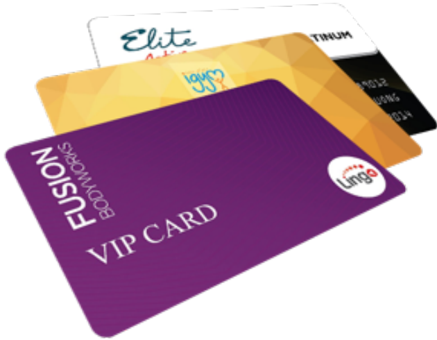
Giải Pháp In Ấn Gia Công Thẻ Nhựa

Thẻ nhựa là công cụ nhận diện không thể thiếu trong doanh nghiệp. Từ thẻ Nhân viên, thẻ Sinh viên, thẻ Giữ xe, thẻ Bảo hành, thẻ Kiểm soát ra vào – mỗi chiếc thẻ đều góp phần nâng cao tính quản lý chuyên nghiệp và an ninh. Ngoài ra, đây cũng là một phần quan trọng trong bộ nhận diện thương hiệu của tổ chức chuyên nghiệp.