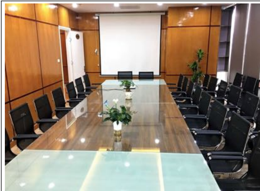
Giải Pháp Phòng Họp Trực Tiếp (offline)

Phòng họp được trang bị đầy đủ tiện nghi hiện đại, đáp ứng nhu cầu tổ chức các buổi họp trực tiếp (offline) chuyên nghiệp, hiệu quả. Đồng thời, hệ thống họp trực tuyến (online) được tích hợp giúp kết nối linh hoạt, hỗ trợ làm việc từ xa, tạo điều kiện trao đổi thông tin nhanh chóng và tối ưu hóa hiệu quả quản lý.