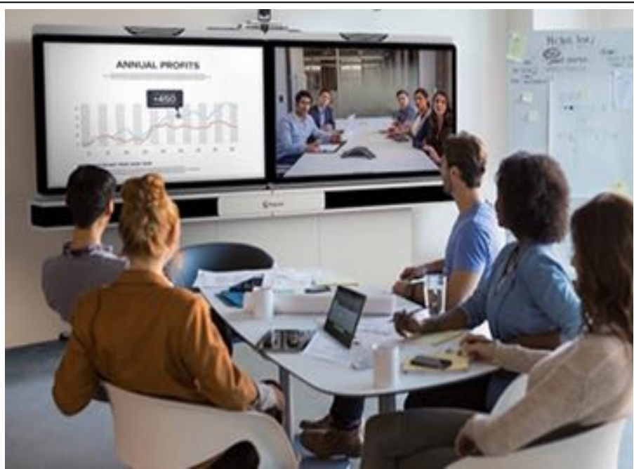
Giải Pháp Phòng Họp Trực Tuyến (online)