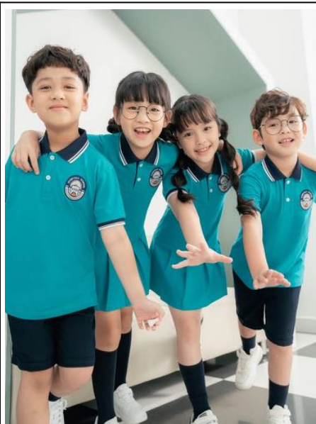
Đồng Phục Giáo Dục